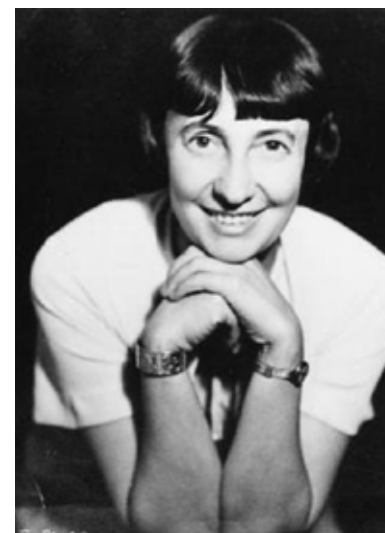
Margarete Schütte-Lihotzky

Under mellankrigstiden ser vi hur flera nyutexaminerade kvinnor i Europa är med och formar det nya vardagslivet. Margarete Schütte-Lihotzky (1897–2000) kom att bli Österrikes första kvinnliga arkitekt efter studier vid Kunstgewerbeschule och Konstakademien i Wien. 7 Hon blev en pionjär i fler avseenden. Det rådande samhällsklimatet väckte hennes sociala engagemang – arkitektuppgiften handlade nu om betydligt mer än att rita vackra hus åt förmögna beställare. Som ung arbetade Margarete (ibland kallad Grete) bland annat i nära samarbete med den omskrivna Adolf Loos – exem-