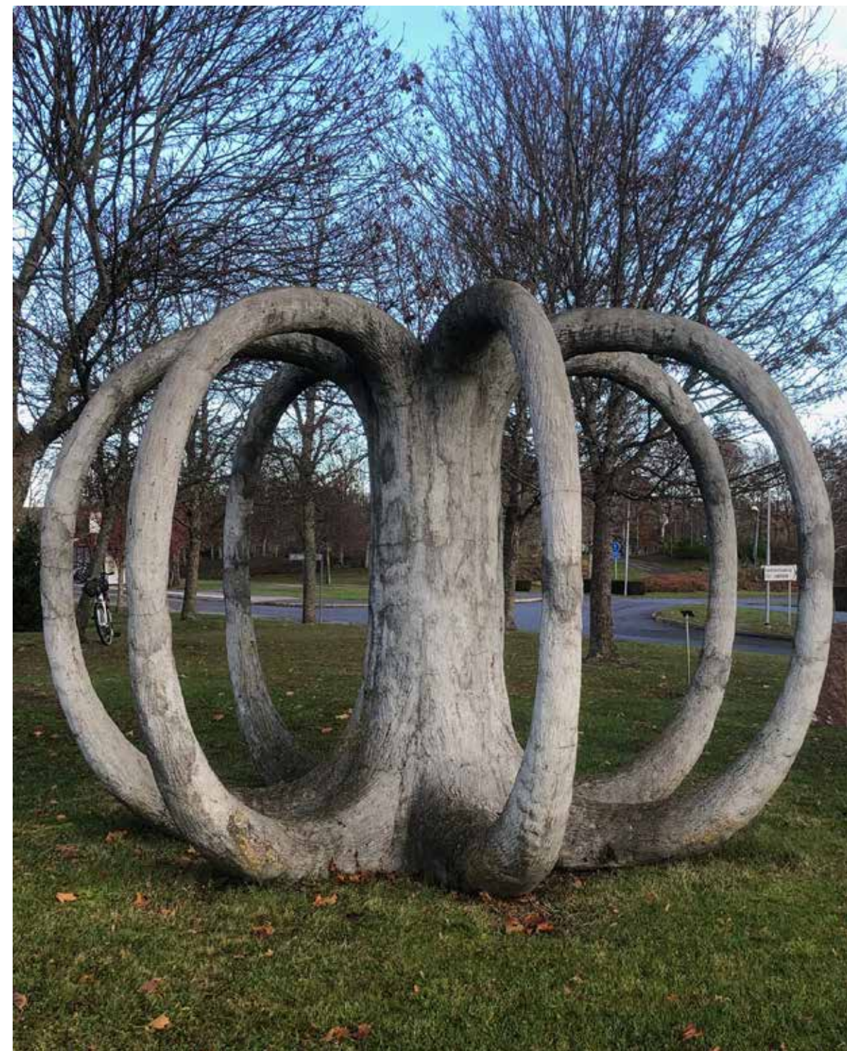
Arbor Vitae, Livets träd 2011.

Jag uppfattar att skulpturen och berättelsen för en dialog med varandra. Det hela vittnar om hur fantasi och miljöengagemang kan förenas på ett filosofiskt och humoristiskt sätt. Idag växer endast lavar i gult och grått på trädets stam – det enda tecknet på liv.