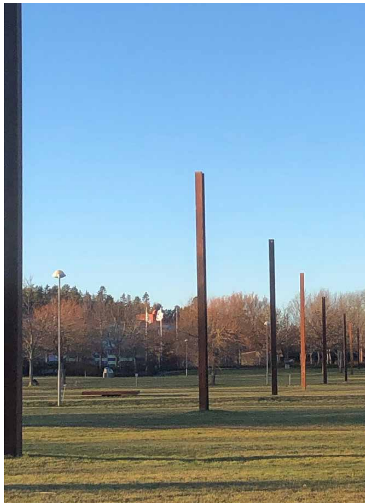
Rakt upp och ned , 1999. Foto: Eva Flogell

Andra konstverk som Sagefors skapat är Vanda de Lux från år 2000, som är uppförd vid Vandavägen i Akalla i Stockholm. Konstverket består av belysningsstolpar med varierande höjder och med armaturer i olika diametrar. Ljuskällorna har olika styrka och färgtemperatur. Konstnären säger själv att hon velat skapa ett landmärke som förbipasserade kan betrakta i förbifarten eller passera i lugn och ro.