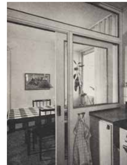
Kök i ett av radhusen längs Riksrådsvägen.

Charlotte Perriand och Léonie Geisendorf gjorde alla avtryck på den gestaltade miljön under denna brytpunkt – anmärkningsvärt i sig om man beaktar det faktum att kvinnor ännu var i minoritet. Och även om dessa arkitekter sinsemellan uppvisar en bredd, med byggnader och föremål designade för såväl offentliga som privata ändamål, kan man se hur samtliga visar en betydande omsorg om det vardagliga livet. Idag är det en självklarhet att oavsett kön kunna ägna sig åt det här fältet – även om de arkitekter som hamnar i rampljuset inte sällan är män – och det återstår att se vilka från vår egen tid som kvalar in i historieskrivningen.