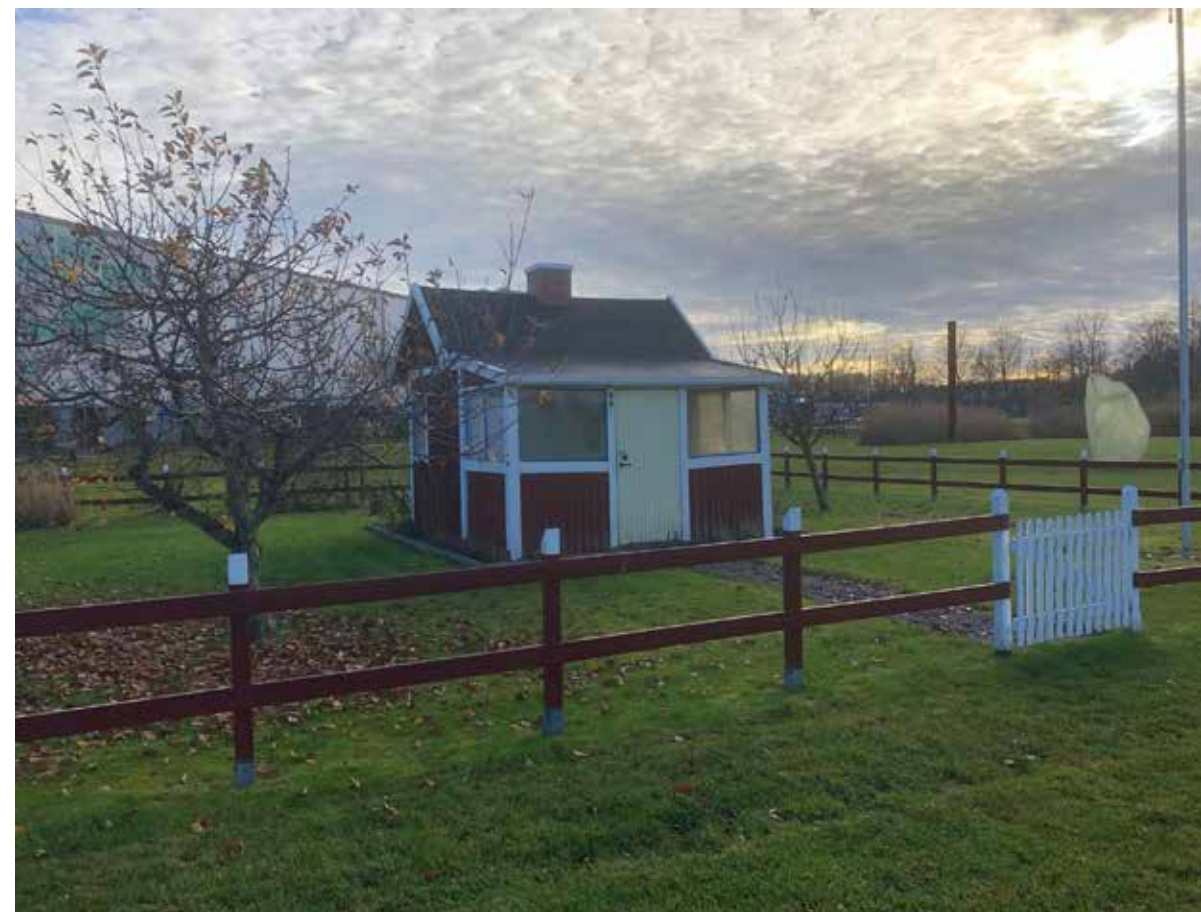
Gamla Valla koloniområde Ett levande monument, 2003.

krigens ransoneringar och livsmedelsbrist. Initiativtagarna hade många väl genomtänkta idéer kring folkhälsa och för hela familjen. En flaggstång står innanför staketet. Koloniträdgården är dock inte enbart en svensk företeelse, vi fick idén via Tyskland och Danmark men den svenska flaggan markerar här svensk identitet i likhet med röd stuga. Framför allt är stugan en påminnelse om vår historia, även om kolonilotterna än i dag är eftertraktade för hobbyodling och eventuell samvaro med andra odlare.