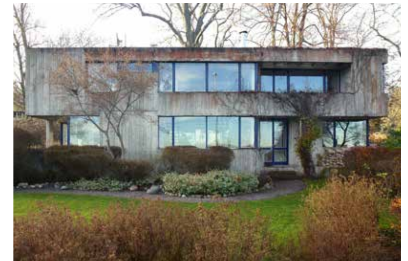
Villa Delin (1966–1970) av Léonie Geisendorf.