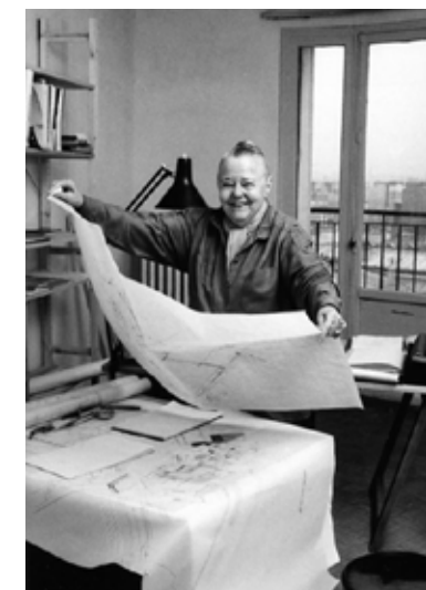
Charlotte Perriand i sin studio.

pelvis i ett projekt med syfte att uppföra enkla arbetarbostäder i Wiens utkant – även om hon parallellt också hade en egen arkitektbyrå. 8