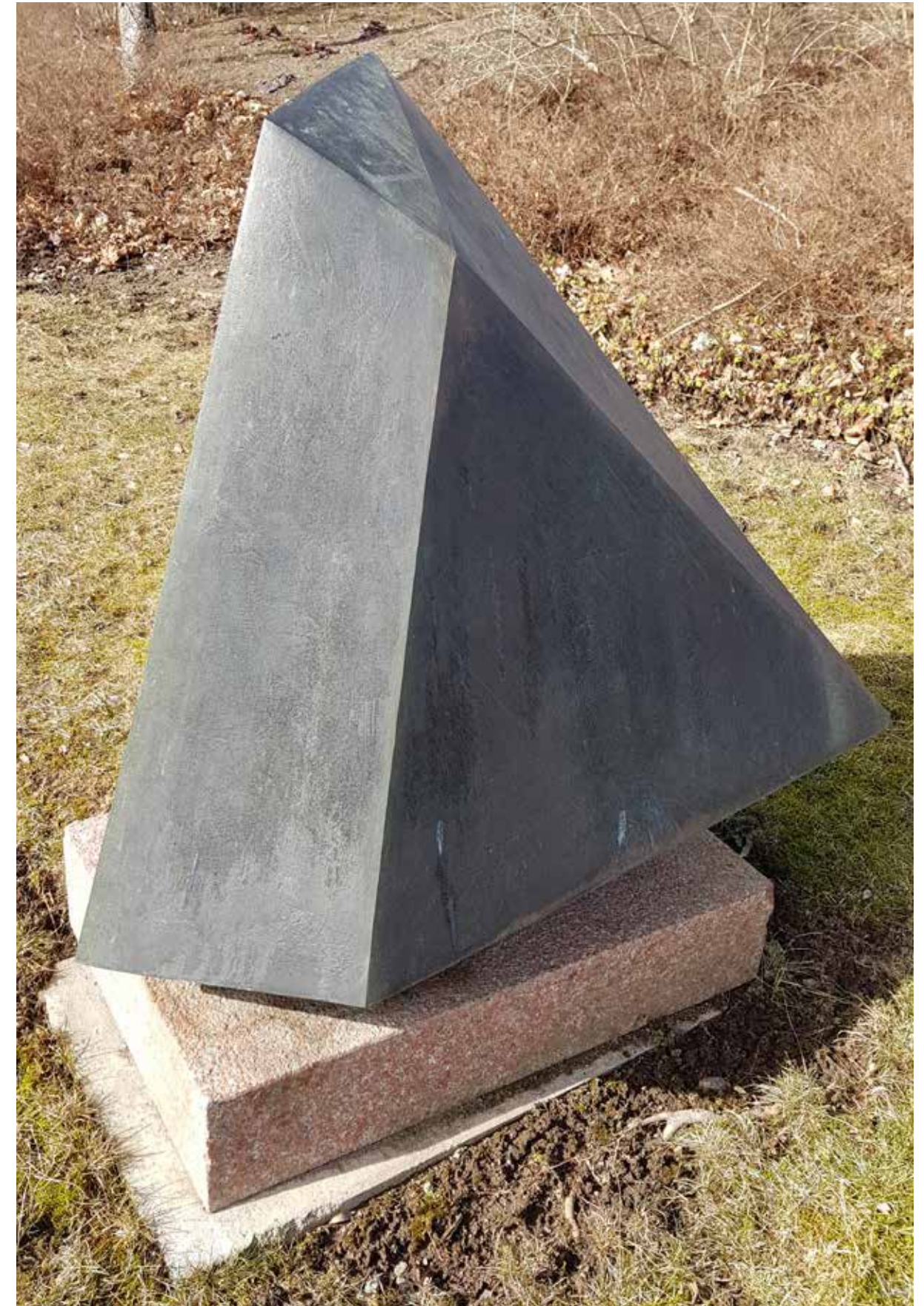
Den dansande dervischen 1989.

Lange arbetar med former i olika material, som hon modellerar med händerna utan mätinstrument i förenklade oregelbundna former som inspirerar betraktare att vidröra dem. Titlarna berättar om Langes inriktning att det är det lilla, som knappast syns och som hon uppmärksammar i förstorade skira former, exempelvis i Stora Vallmon , Näsan , Del av blomma .