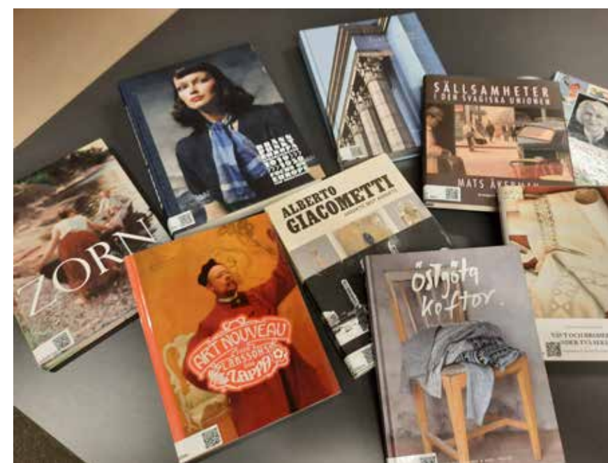
Ett urval.

Samtliga böcker utom katalogen till Per Engshedens klänningar för Sara Danius finns att låna på Linköpings universitetsbibliotek, alla kan få lånekort.