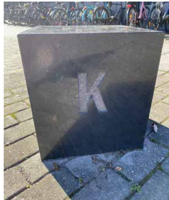
I morgon kommer något underbart att hända, 2000.