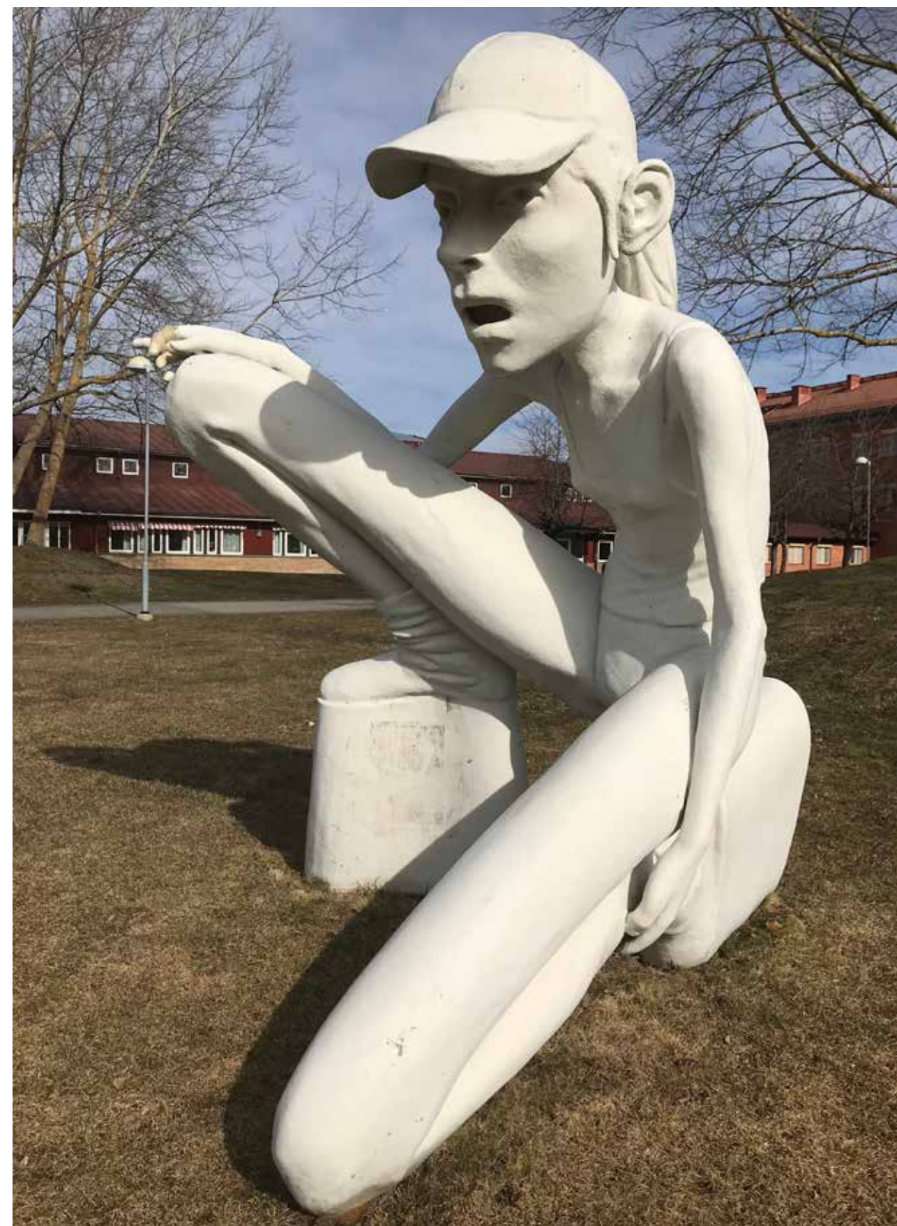
F-ble dimensions variable , 2009.

Källor: https://sv.wikipedia.org/wiki/Cajsa_von_Zeipel https://www.recidencemagazine.se/konst https://www.omkonst.se/13-von-von-cajsa https://www.goteborgskonstmuseum