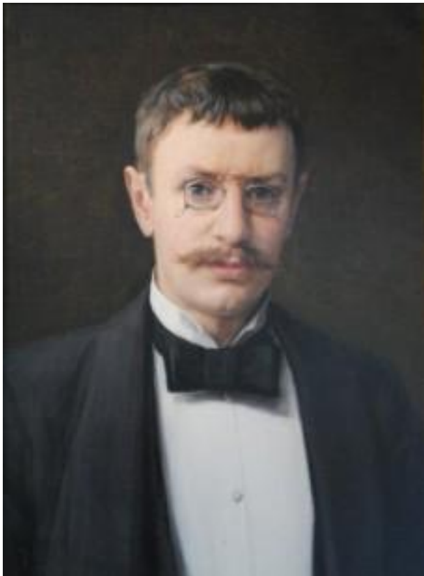
Johan Krouthen självporträtt 1895, Norrköpings konstmuseum