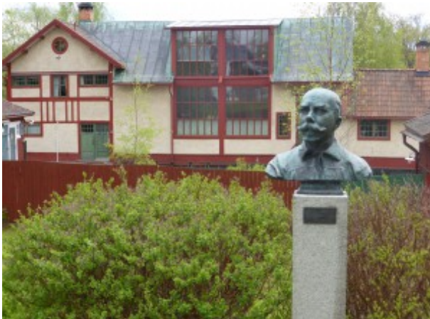
Byst av Carl Larsson med hans ateljé i Lilla Hyttån i bakgrunden