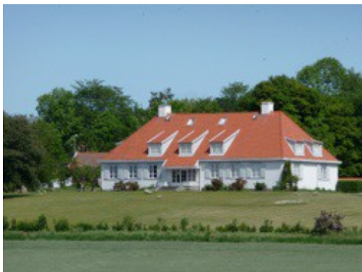
Örgården utanför Vadstena