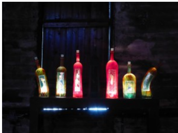
Glasskulptur av Kjell Engman på Avesta Art

Mycket nöjda och stimulerade, kanske något utmattade, vände vi åter till Linköping på kvällskvisten!