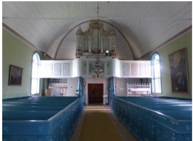
Kyrkan i Sundborn