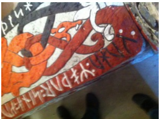
Kista med runor.