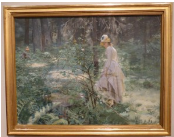
"Törnsåret" akvarell av Anders Zorn, Zornmuséet.

Mot Mora styrde vi den andra dagen och kunde där se både kända målningar och några fina mindre kända akvareller av Zorn. En guide med berättelser om Anders och Emma Zorns liv ur ett etnologiskt perspektiv befäste mycket av de föreläsningar som vi lyssnat till under våren. Med fina nyanser både i stort och smått kände vi oss berikade av besöket.