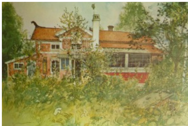
Carl Larsson Stugan