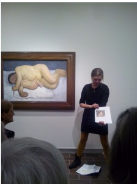
Paula Modersohn-Becker: Liggande mor och barn

Förutom denna utställning hann vi också med David Hockneys fantastiska kolteckningar av naturstudier och Ricard Mosse suggestiva bilder från kriget i Kongo.