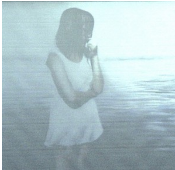
Den vita klänningen av Karin Broos

I Karin Broos målningar förekommer ofta olika motiv på kvinnor, antingen enskilda eller i samhörighet med andra kvinnor, som ofta avbildas nära eller i vatten.