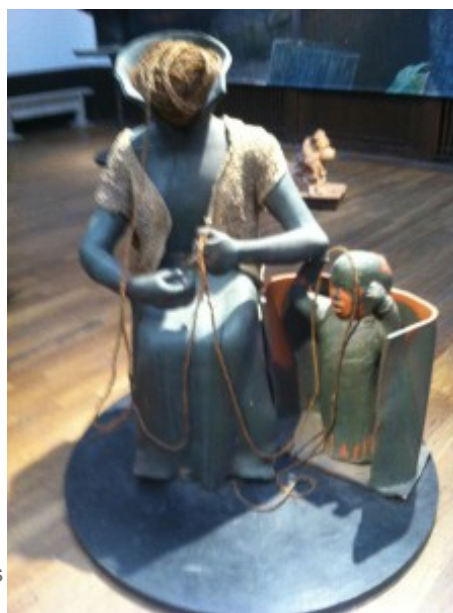
Skulptur av Hertha Hillfon