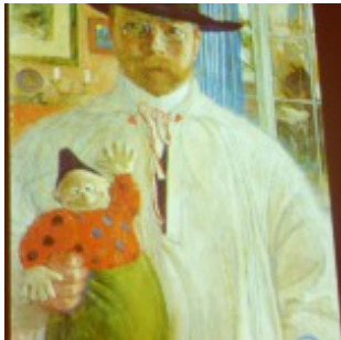
Carl Larsson, Självporträtt