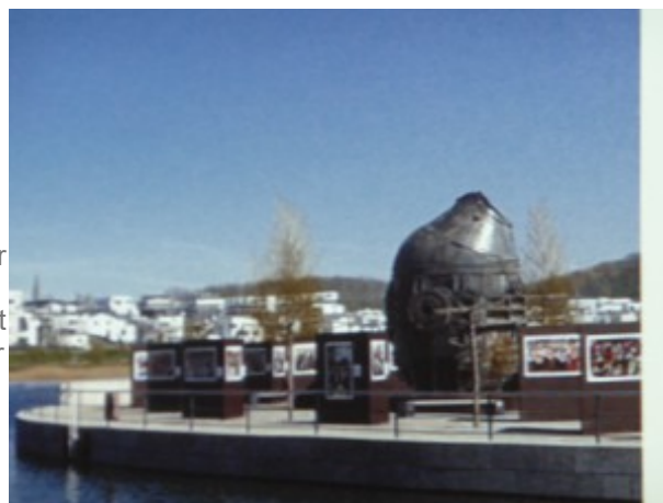
Skulptur- och konstpark i Ruhrområdet

Från konst- och kultursynpunkt finns här ett stort utbud. Här finns en skulpturpark med fascinerande inslag av gruvnäringens föremål som på ny plats och med belysning har blivit till jätteskulpturer. Också finns skapade luft-labyrinter med utsiktsplatser och spännande bestigningar i trappor. En upplevelsepark skulle man kunna kalla dessa stålkonstruktioner. De gamla verkstadshallarna, som har en oerhörd rymd, har omvandlats och utnyttjas till miljöer för uppsättningar av operor, teatrar och konserter, vilka går under namnet "Ruhr Triennialen". En utvald kulturperson, regissör eller dirigent får under tre års tid uppdraget att göra kulturrevenemang av stora mått. Under den varma delen av året från april till september blomstrar kulturverksamheten med alla typer av uppsättningar och utställningar.