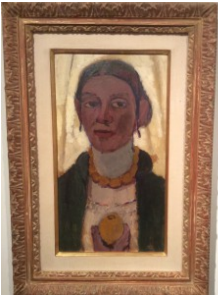
Självporträtt Paula Modersohn Becker

Efter studier av Paula Modersohn-Beckers korta dramatiska liv 1876-1907 och hennes säregna konst företog alla tre Konstvetarseminarierna en studieresa till Louisiana, för att på plats betrakta hennes speciella konstuttryck. I vår guidning fick vi stifta bekantskap med de vanligaste motivkretsarna i hennes konst: självporträtten som återkommande och utforskande tema, modern och det ammande barnet, porträtteringen av landsbygdens människor och hennes serie kring björkstammar som bryter upp ur jorden.