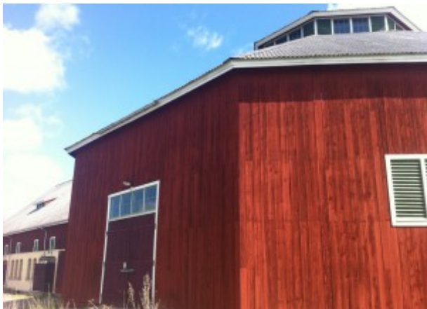
Sörby Rundloge