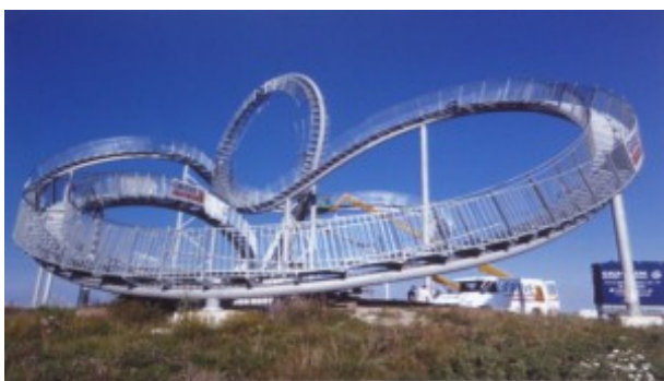
Utsiktstorn "Tiger & Turtle i Ruhrområdet

År från år, berättade Wolfgang, utvecklas nya delar av detta område som inte är större en Östergötland och har 11 miljoner invånare. Ja, tänk att så intressanta kulturmiljöer kan finnas så nära vårt eget område och att så få har hört talas om det!