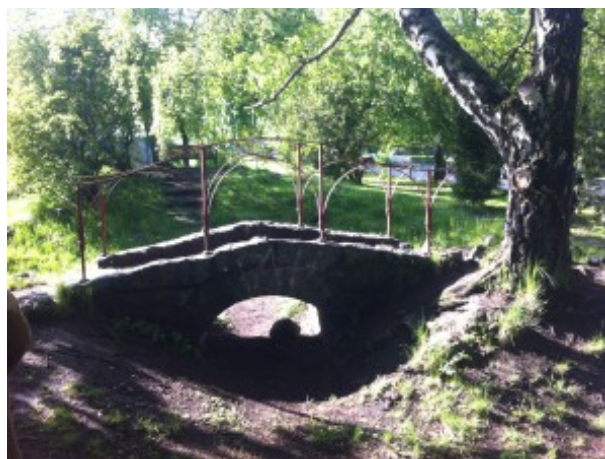
Gammal bro i Lärarhögskolans park

Detta är ett urval av parker i Linköping som lockar till besök och ger spännande perspektiv på vår nutid och dåtid.