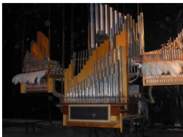
"Glänta av Jens Peterson-Berger & Olov Ylinenpää, Avesta Art