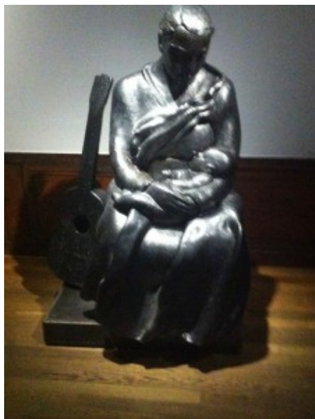
Skulptur av Hertha Hillfon

Wallenbergsalen en torsdagskväll i oktober! Ett 60 tal personer har samlats för att lyssna på Mårten Carstenfors, chef för Liljevalchs konstmuseum och Stockholm konst.