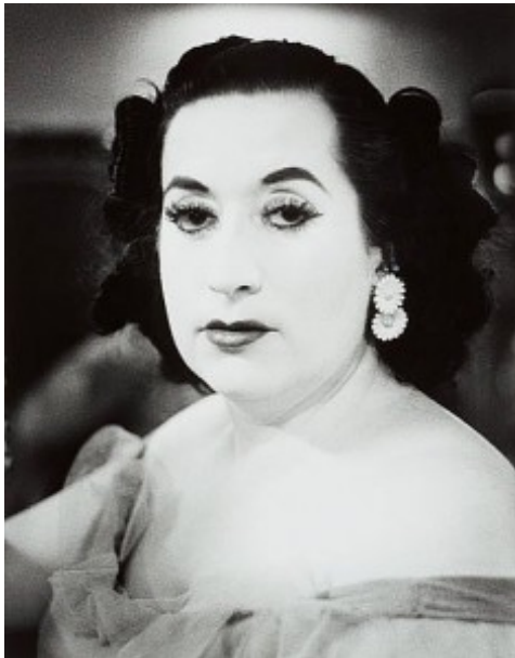
Christer Strömholm, Bleka damen Barcelona

Genom åren har Konsthistoriska klubben tagit upp många ämnen och infallsvinklar på konst och konstens förutsättningar och villkor. Denna kväll är det dags att fundera över ytterligare ett sätt att se på konst, nämligen hur man visar och organiserar en utställning. Vad gör egentligen en utställningskurator?