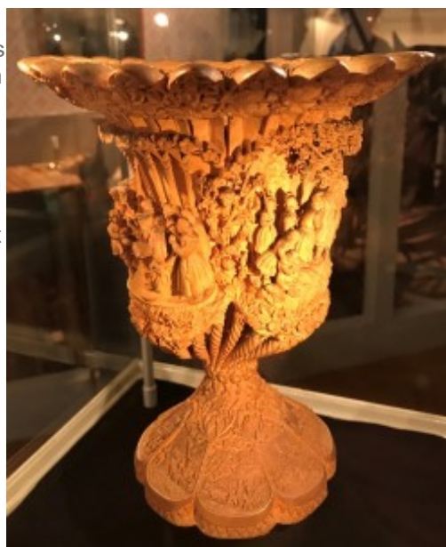
Sophia Isberg, Brysselpokalen

Besöket avslutades med kaffe och kanelbulle innan hemfärd till Linköping.