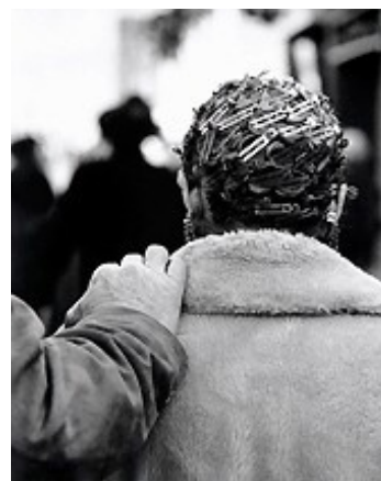
Christer Strömholm, Los Angeles USA 1963 / Bildverksamheten Strömholm