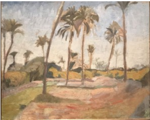
Ivan Aguéli. Afrikanskt landskap ca 1914-1915

Vår skickliga guide följer oss också på Thielska galleriet. Ivan Aguéli (1869-1917), egentligen John Gustav Aguéli, är vår nästa spännande konstnär. Han räknas till en av den svenska konstens förnyare som man också kan se när man följer hans produktion i utställningen. I hans livsresa finns mycket av influenser från hans vistelse i andra länder som Frankrike, Spanien, Egypten och andra delar av fjärran östern. Man kan tydligt se hans påverkan av Cézanne och andra modernister. Han arbetar ofta i små format och med färg, speciellt blått, ockra och blyvitt och framförallt i formerna får hans målningar sin särart. Han utforskar samtidigt tillvarons andliga dimensioner där Emanuel Swedenborg är en av hans stora inspiratörer. Han är också en lingvist av stora mått, då han på egen hand lärt sig ett flertal språk. I hans kringflackande liv finns ett ständigt sökande både konstnärligt, andligt och politiskt. Hans liv slutar tragiskt då han blir påkörd av ett tåg i Spanien. Det spekuleras om det var en olycka på grund av att han hade nedsatt hörsel eller om han blev knuffad framför tåget.