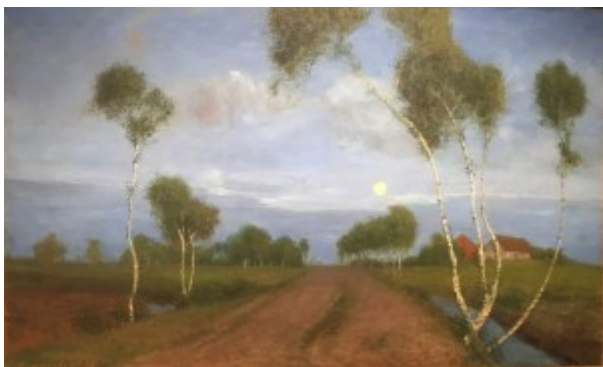
Fritz Overbeck. Kväll på myren 1896

Den mest kända konstnären är förstås Paula Modersohn Becker, som med sina landskapsskildringar, porträtt av landsbygdens människor och sitt eget avklädda självporträtt som får oss att inse vad hon åstadkom i ett tidigt 1900-tal. Men som hon först postumt fick erkännande för.