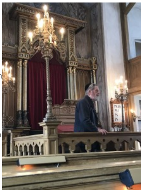
Peter Freudenthal

Bakom ett rött draperi i fonden finns ett skåp "den heliga arken". Skåpet är avsett för Toran i form av pergament som är upprullad på två träkäppar. Toran är judendomens heligaste föremål. Den innehåller de skrifter som ligger till grund för den judiska tron d.v.s. de som vi i den kristna tron benämner Moseböckerna.