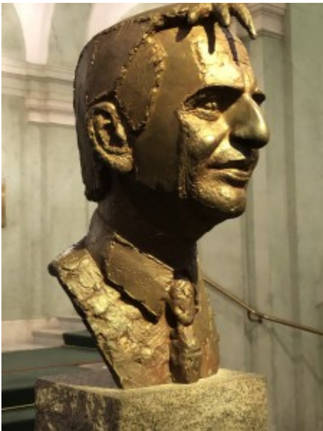
Thomas Quarsebo, byst av Olof Palme

Något utmattade men mycket nöjda traskar vi längs Riksgatan fram till vår väntande buss!