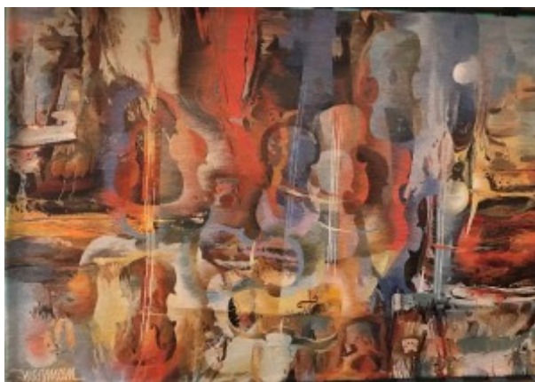
Vävnad i Konserthuset

I detta vårt mest genomarbetade och utsmyckade Swedish Grace-monument vandrar vi och får hjälp att förstå bakgrunden och utformningen av denna nationalbyggnad. Byggnaden uppfördes 1924 – 1926 efter ritningar av arkitekt Ivar Tengbom i svensk 1920-talsklassicism och var en av de första byggnaderna i Sverige som var särskilt avsedd för orkestermusik. En demokratitanke var bland annat att alla skulle komma genom samma entré och mötas av samma utsmyckningar. Det antika templet med en kolonnad bildar entré till byggnaden Akustiken var emellertid inte arkitektens prioritering så den har byggts om vid fler tillfällen. Utsmyckningen är däremot genomtänkt i varje detalj.