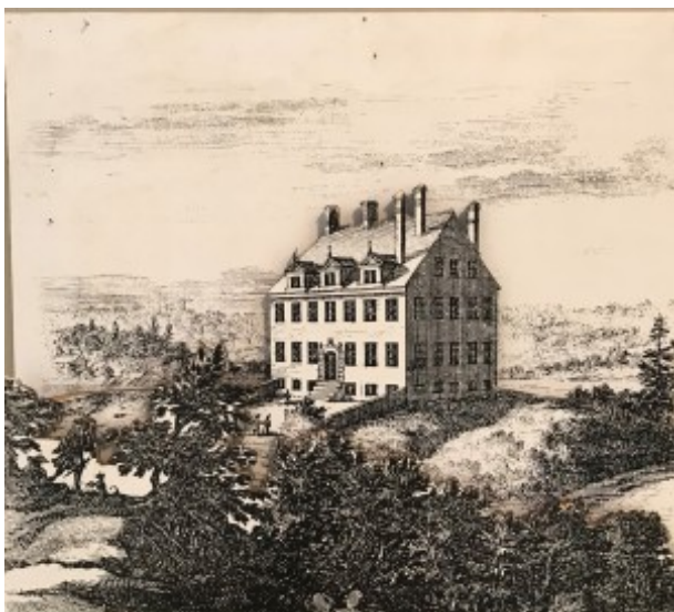
Äldre bild av Charlottenborgs slott

En vacker augustidag samlades ett tjugotal av KKLs medlemmar för att göra en utflykt till Charlottenborgs slott i Motala. Där togs vi emot av Camilla Gullin som guidade oss på slottet.