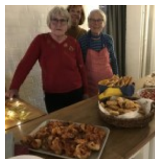
KKL's festkommitté