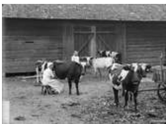
Korna mjölkas i Svinhults prästgård