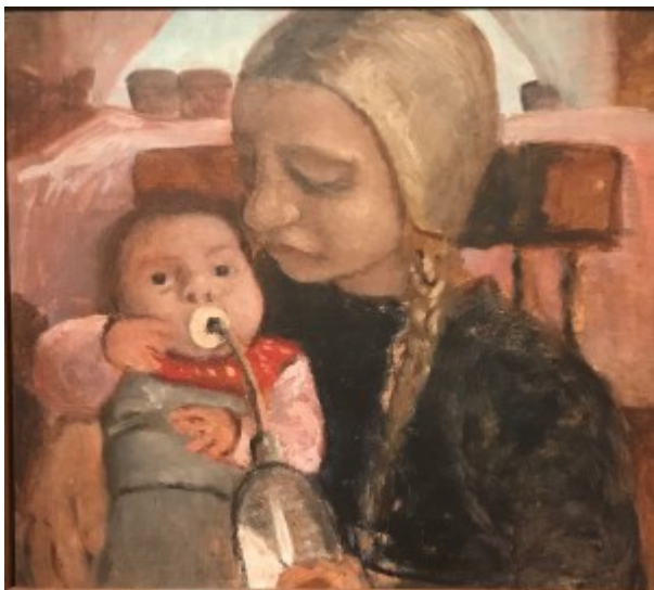
Paula Modersohn-Becker. Flicka med barn som suger på napp 1906