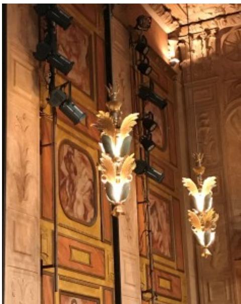
Lampor i Grünewaldsalen

Vi prickar in en riktigt gråmulen novemberdag för vår höstutflykt. Glada ansikten möter när vi samlas på Borggården. Roligt att flera av våra nya medlemmar har slutit upp! Resan går till Stockholm med första anhalt Konserthuset. Guiden Viktoria möter med välartikulerad stämma och en säker framtoning.