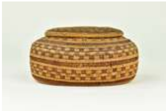
Flätad oval ask Östergötlands museum